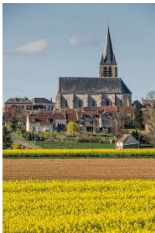
Église de Bromeilles